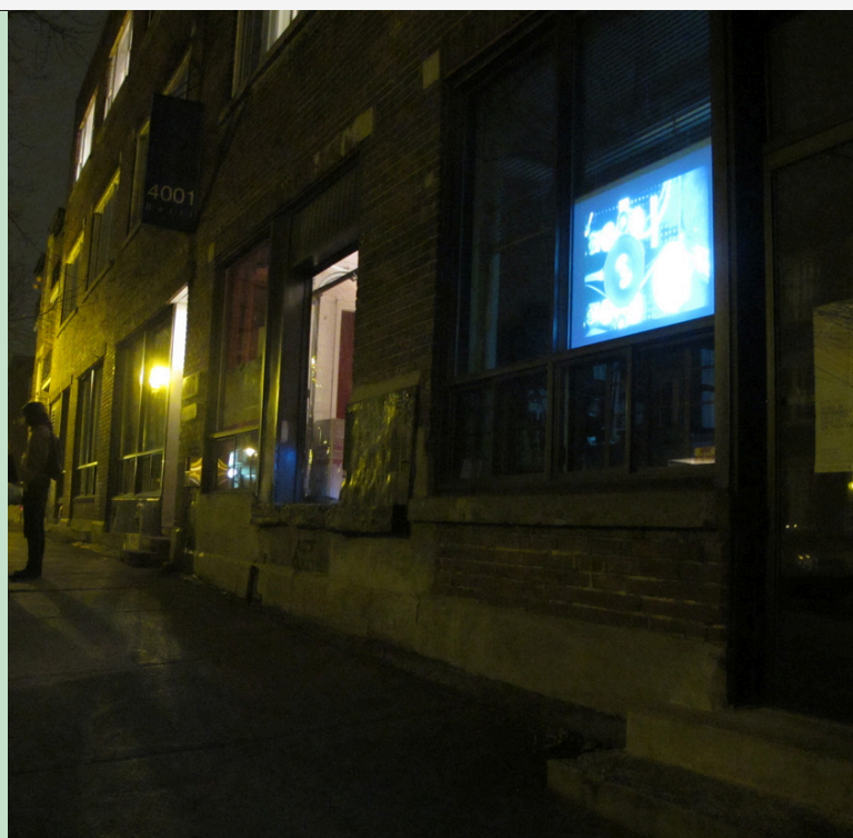
VUE DU 4001 BERRI.